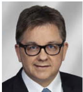
Präsident: Guido Wolf, CDU

Geboren 1961 in Weingarten, verheiratet. Nach dem Jura-Studium Dezernent beim Landratsamt Tuttlingen, dann bis 1993 persönlicher Referent des Verkehrsministers. 1993 bis 1994 Richter am Verwaltungsgericht Sigmaringen. 1994 bis 1996 Referatsleiter im Staatsministerium. 1996 bis 2003 Erster Bürgermeister von Nürtingen. Von Januar 2003 bis November 2011 Landrat in Tuttlingen. Seit April 2006 Mitglied des Landtags. Seit Oktober 2011 Präsident des Landtags.